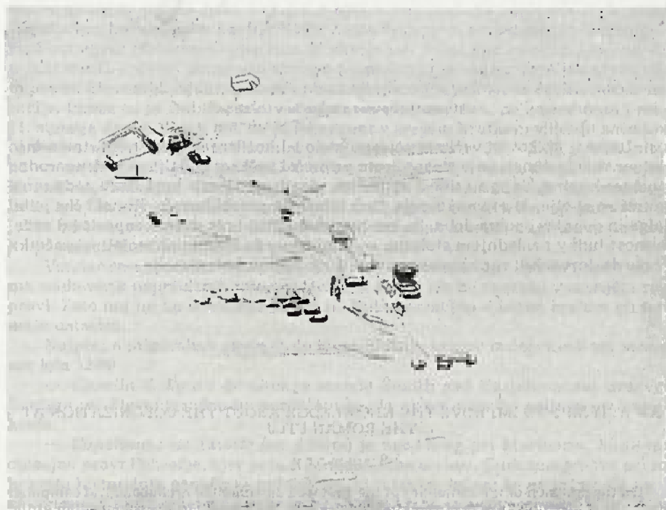
2. Skicil iz risarskega študija lege rimskega mesta v naravnem okolju (I. Mikl-Curk l. 1988)

Razmere v pozni antiki se izbranim raziskovalnim parametrom in tako ponostavljeni rekonstrukciji dogajanja upirajo. Epigrafsko gradivo je seveda tudi za tisti čas slej ko prej zgovorno in informativno, a tukaj se bomo za zdaj zadovoljili z opravljenim poskusom. Vsekakor moramo ugotoviti, da arheološki podatki in metoda naše interpretacije opozarjajo na živahen pretok prebivalstva in izrazite spremembe v staroveškem Ptujju, ki je nosil tudi naziv kolonije. Sila tradicije je gotovo pomembna zgodovinska zakonitost. Del etničnega substrata preživi tudi velike katastrofe. Toda v organizirani državi z močno centralno oblastjo — in rimski imperij je to mnogokrat tudi bil — se je izoblikovala tej nasprotna zakoni-