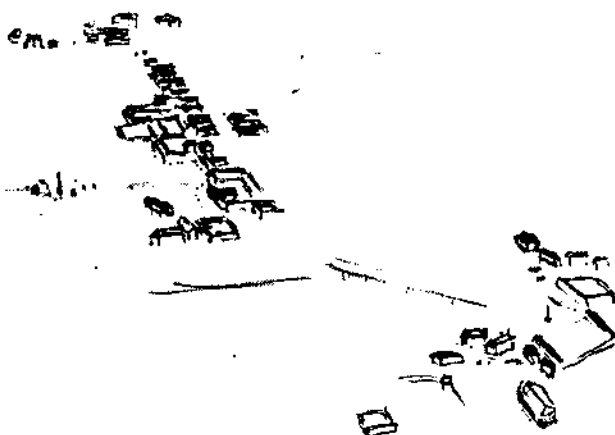
b) ponazarja pogled z iste točke v 4. stoletju.

tost: Imperij je, kot so večkrat zapisali, deloval kot izrazit »topilnik« etničnih in plemenskih lastnosti in je staroselcem primešal večkrat oddaljene in drugorodne etnične skupine. Te so se zile z domačini, včasih so izginile brez sledu, toda mnogokrat so okolje, ki so vanj zrasle, tudi temeljito preoblikovale. Rimski čas je bil dolga in dogajanj polna doba. In ker bo rimski Ptuj brez dvoma zaposloval vedoželjnost tudi v naslednjem stoletju, se je bilo morda vredno ob stoletnici začetka Ferkovih terenskih raziskovanj pomuditi ob pojmu kolonizacije.