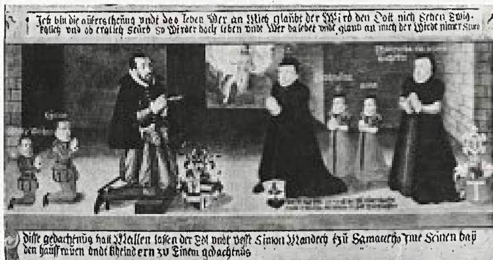
POKRAJINSKI MUZEJ MARIBOR KRISTUSOVO VSTAJENJE (detalj slike — družina Simona Mandechna)

na za spomenik na prostem, morda pa je visela v kakšni kapeli, vsekakor v zaprtem prostoru. Po strukturi platna slike sklepamo, da gre za kopijo po starejšem izvirniku. Zasnova kompozicije in barvna ubranost (npr.: močno kontrastna osvetlitev oblakov, značilna za 16. in 17. stoletje, besedilo napisov, način pisave, itd.) pa prav gotovo ni ponaredek, ampak ta zvesto posneti po originalu. Dokumentarna je slednjič tudi noša upodobljene družine.