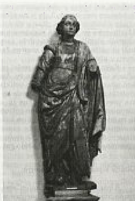
KIP SV. BARBARE IZ CERKVE SV. BARBARE NAD ŠMARJEM PRI JEJŠAH, DANES V MARIBORSKEM MUZEJU, 1661

segmentih in ena vrh atike. K plastičnemu videzu nastavka prispevajo še angelške glavnice, razmeščene po volutah, spodnjih delih stebrov in vpete med okrasje ogredja. V celoti je nastavek rezbarsko izredno razgiban, k nemiru, ki ga izžareva, prispeva še pozlata in oživlja sicer statično zasnovane plastike.