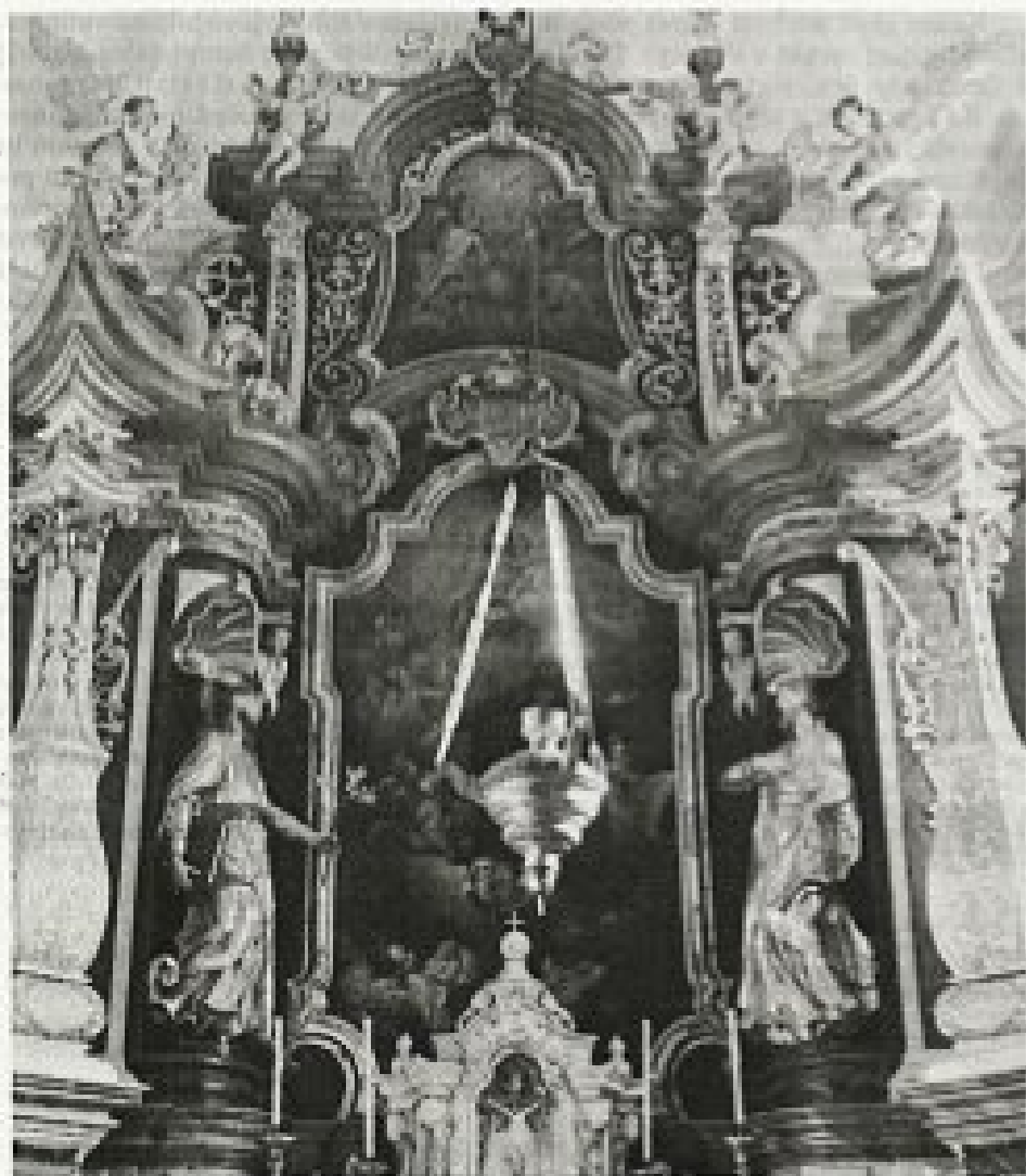
OLTAR SV. IGNACIJA V OKONINI, OK. 1722

tarjev. Oltarja stojita v kapelah, ki sta bili pozidani — Ignacijeva leta 1722 in kapela sv. Janeza Nepomuka leta 1723. Zdi se verjetno, da so v istem zaporedju postavili tudi oltarja: gre za isti arhitekturni koncept in figuralno razdelitev, ornamentalne dekoracije pa ubirajo dvakrat različno pot.