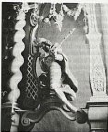
SVETI HENRIK Z VELIKEGA OLTARJA PRI SV. MIKLAVŽU NAD DOBRNO, 2. ČETRTE, 18. STOLETJA