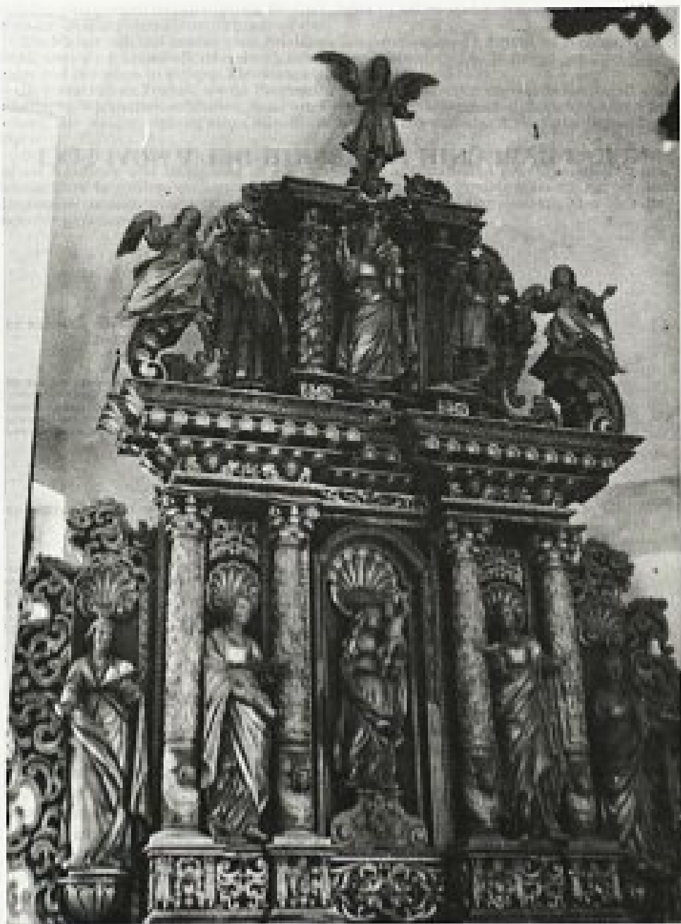
OLTAR SV. ANE, NEKOČ VELIKI OLTAR PRI SV. BARBARI NAD ŠMARJEM PRI JELŠAH, 1651

briča in obdaja hrustančevje, ob straneh ogradja pa sta volutasto zavita segmenta.