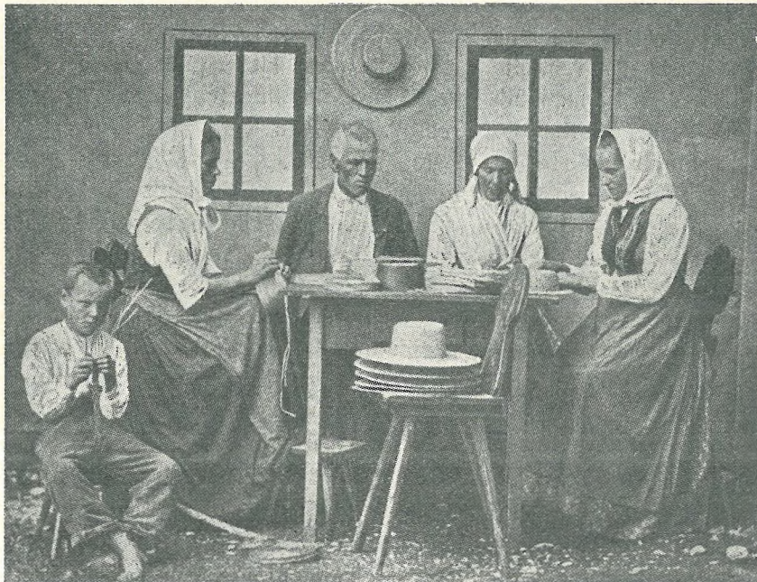
Ihanski slamnkarji — Slika v Domu in svetu 1903, str. 541

Murnik je začetek slamnkarstva postavil v Ihan in v čas okrog l. 1775. 15 Kot je mogoče posneti iz literature, je bil prvi, ki je nastanek obrti s tako točnostjo datiral; ostali pisci se glede nastanka držijo v glavnem Murnikovih ugotovitev. Jovan, ki se sicer sklicuje na poročilo trgovske in obrtne zbornice za l. 1875, torej na Murnika, je bil toliko netočen, ker je zapisal, da je bilo slam-