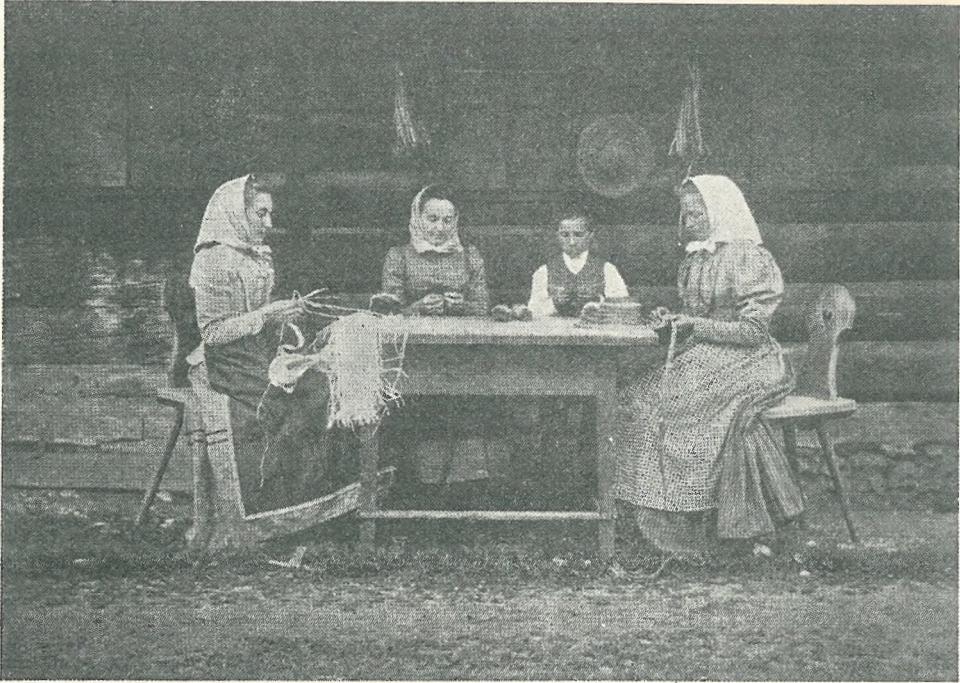
Izdelovanje slamnikov — Slika v Domu in svetu 1903, str. 544

Pletenje kit po kamniškem okraju in nekaterih vaseh sosednih okrajev je bilo tedaj še vedno precej razširjeno. Za pletenje niso uporabljali samo domačo pšenično slamo, temveč tudi boljše inozemske sorte slame. Slamo so le belili ali pa barvali. Prvotno so belili in barvali sami doma, pozneje so to delo prepuščali tovarnam, ki so ga oskrbovale bolj in ceneje. Iz tako pripravljenih surovin so