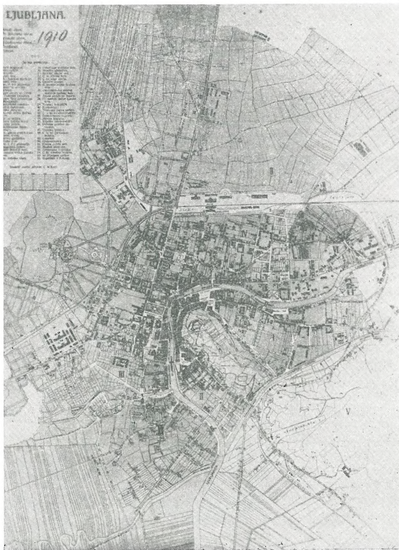
Regulacijski osnutek arhitekta Maksa Fabianija (Vijesti... Društva inženirjev v Ljubljani... Zagreb 1913, str. 91)

Čeprav so bile nove gradnje zelo redke, se je mestni stavbni urad vendarle zavedal, da je treba pričakovati tudi razvoj severnega